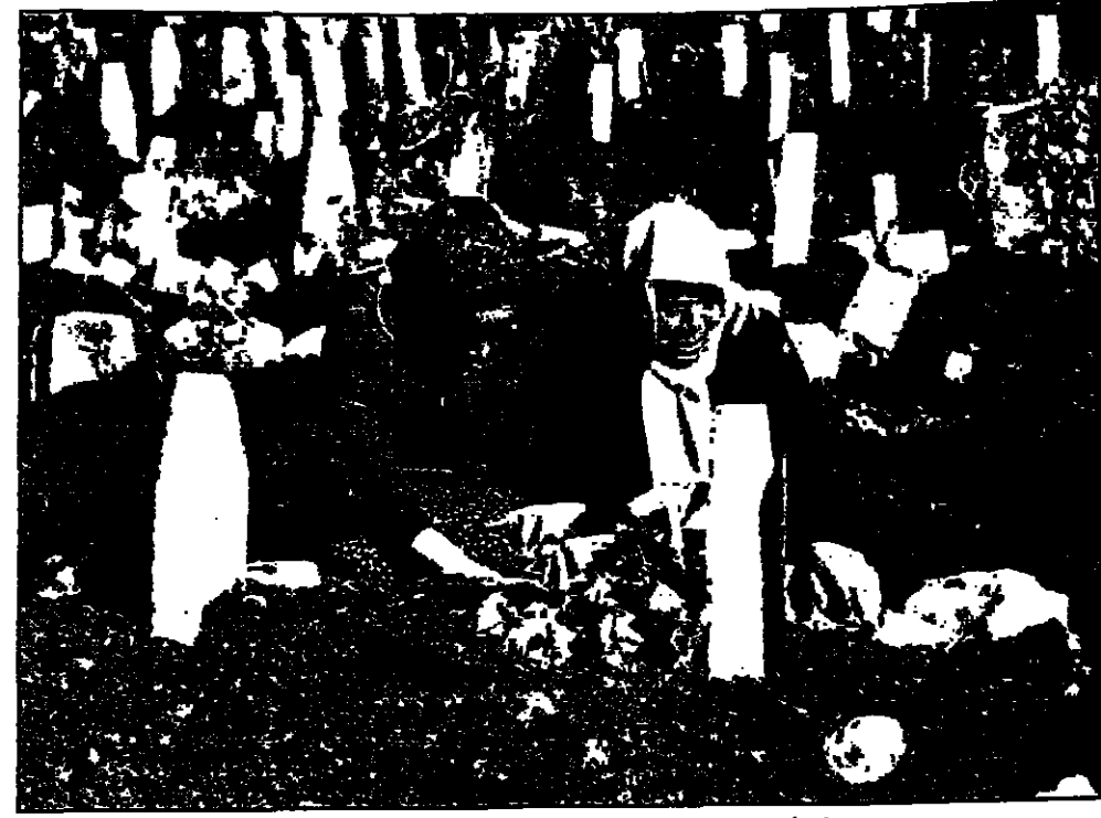
جزائريون يتسمن لهم فهم ضحايا الفلاح الجماعية